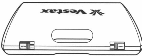
handy trax 本体