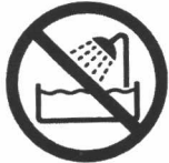
水槽での使用禁止